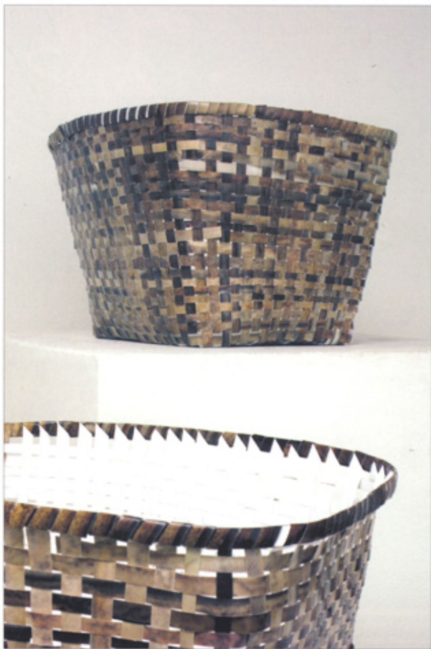
Infusión. Fotografía a color 2005